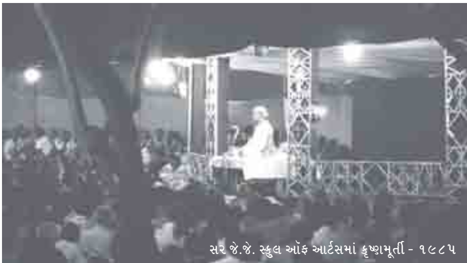
સર જે.જે. સ્કુલ ઑફ આર્ટ્સમાં કૃષ્ણમૂર્તિ - ૧૯૮૫

ચિત્રપટમાં કૃષ્ણમૂર્તિના જે. જે. સ્કુલમાં આપેલા વ્યાખ્યાનો નું મોટાભાગે ચિત્રિકરણ હતું ચિત્રપટના અંતમાં ત્યાંના છેવટના વાર્તાલાપ નું અતિસુંદર દૃશ્ય પડદા પર આવ્યું. કૃષ્ણજી એક નાના વ્યાસપીઠ પર બેઠા છે અને સામે મોટી સંખ્યામાં ઉપસ્થિત એવો શ્રોતાવર્ગ અત્યંત શાંતિપૂર્વક સાંભળી રહ્યો હતો. જીવન વિષે સંપૂર્ણપણે નવી એવી દૃષ્ટિ આપનાર એક અર્વાચિન એવા સંતની વાણી સાંભળનાર ને શું અનુભૂતિ થઈ હશે.