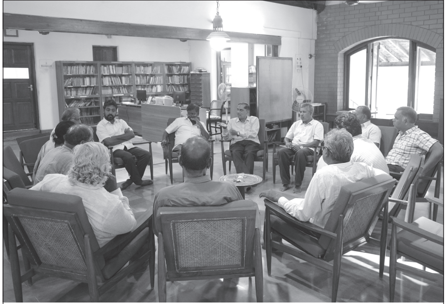
தமிழில் நடந்த இரண்டு நாள் ஒன்றுகூடல் நிகழ்ச்சியின் ஒரு பகுதியாக கடந்துரையாடல்கள் இருந்தன. அதனின் ஒரு காட்சி படத்தில் காணலாம். இதே போன்று ஆறு குழுக்களாக வசந்த விஹாரில் கலந்துரையாடல்கள் நடைபெற்றன.